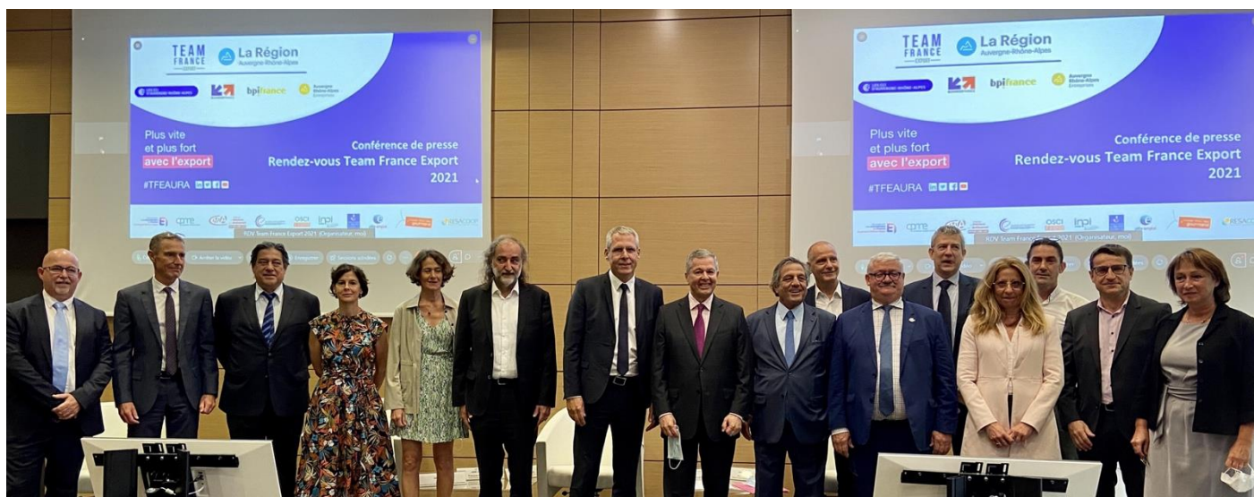
La Team France Export Auvergne-Rhône-Alpes

L'édition 2021 des « Rendez-vous de la Team France Export Auvergne-Rhône-Alpes » ( à découvrir en 30" de vidéo ) se tiendra du 5 au 14 octobre 2021 dans toute la région :